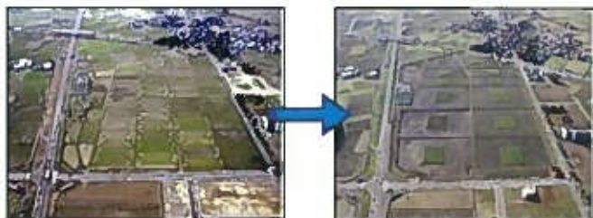
6a区画を1ha区画に拡大