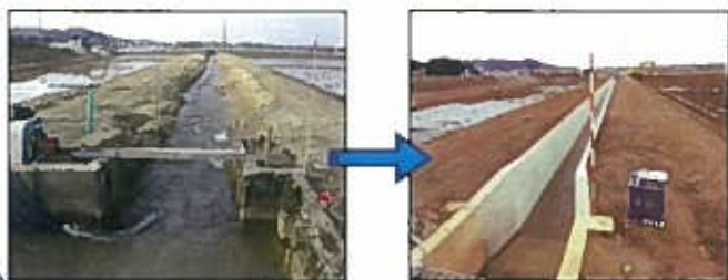
H25年4月に竣工した上中田排水路 (土水路を排水フリューム1200×1200に更新)