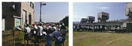
昨年度用水学習の状況 (十ヶ字頭首工)

このような多面的機能を持ち合わせている土地改良施設の役割を身近に知ってもらおうと、当改良区では管内の小学校を対象に用水学習等を開催し、小学校児童から土地改良施設の役割について学習していただいております。